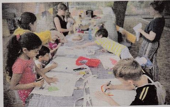
Die Wandelbar als Ort für Kreativität: Kinder und Erwachsene nähten, malten und bastelten am vergangenen Sonntag.

Treysa. Klein aber fein - so können die Projekte beschrieben werden, die die vielen in der Treysaer Altstadt vertretenen Vereine und Institutionen derzeit anbieten. Im Rahmen der Veranstaltungsreihe „Teamegeist in Treysa - die Altstadt ist wandelbar“ finden regelmäßig Angebote statt, die zum Mitmachen und Kreativsein animieren. Die Projektreihe wird durch Landesmittel aus dem Wettbewerb „Ab in die Mitte“ gefördert. Am vergangenen Sonntag beispielsweise traf das „ARTmobil“ vom Verein „Arbeit und Bildung“ auf die Wandelbar - einen mobilen, aufklappbaren Anhänger, der als wiederkehrendes Element