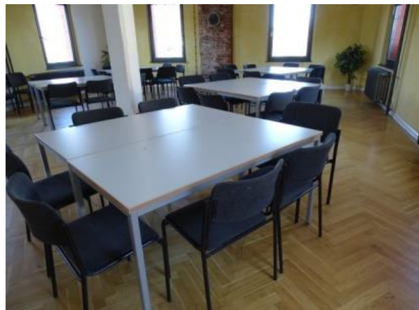
Bildunterschrift: Verwaiste Unterrichtsräume bei Arbeit und Bildung, aber zu Hause geht der Unterricht weiter.