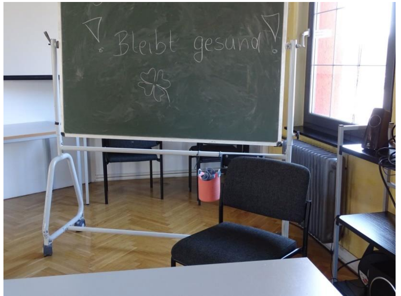
Bildunterschrift: Verwaiste Unterrichtsräume bei Arbeit und Bildung, aber zu Hause geht der Unterricht weiter.