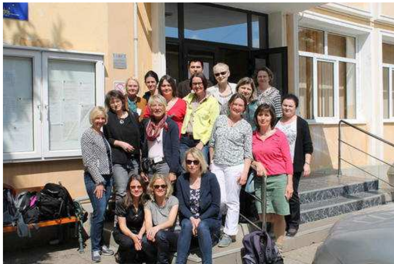
Die heimischen Lehrerinnen tauschten sich mit ihren rumänischen Kollegen aus.

Die Käthe-Kollwitz-Schule, die Kaufmännischen Schulen sowie die Beruflichen Schulen Kirchhain vertieften bei einer Studienfahrt ihre internationale Zusammenarbeit mit rumänischen Schulen.