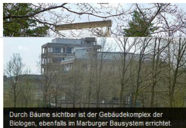
Durch Bäume sichtbar ist der Gebäudekomplex der Biologen, ebenfalls im Marburger Bausystem errichtet.